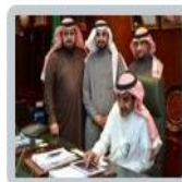
تدشين بوابة التعلم الإلكتروني