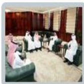
تدشين الموقع الإلكتروني الجديد للجامعة