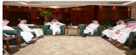
معالي مدير جامعة سلمان يلتقى المجلس الطلابي للجنة التحضيرية