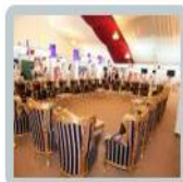
الملتقى السنوي الأول للجامعة