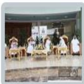
معايدة عيد الفطر 1433