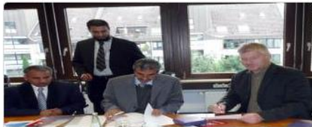
جامعة سلمان توقع مع هيئة المانية للاعتماد الأكاديمي