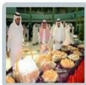
معايدة الأضحى المبارك 1433